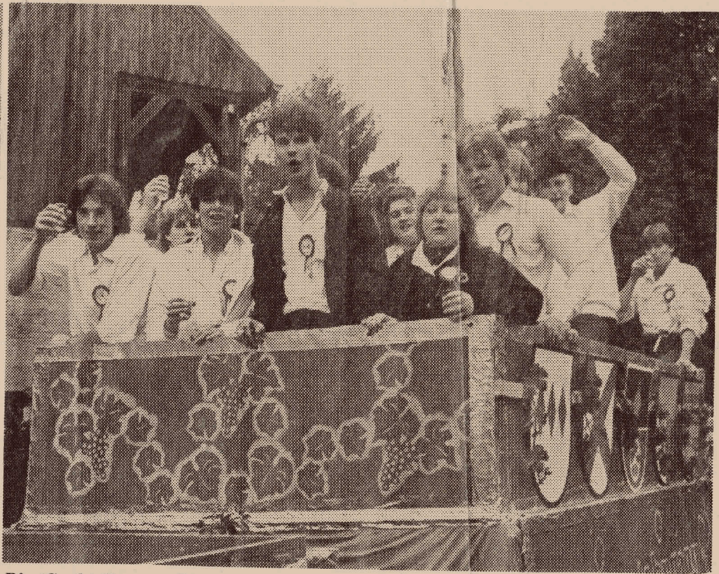
Die „Sankt-Gereons-Kirche“ fuhr im vergangenen Jahr in „Miniatur“ auf dem Wagen des Kerwejahrgangs mit. Überall herrschte ausgelassene Freude und viel Stimmung bei den Jugendlichen.