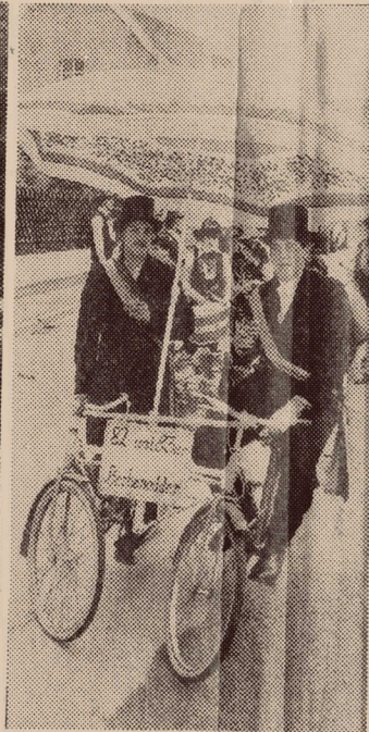
Die „Kerwevadder“ von 1982 und 1983 präsentierten sich im abgelaufenen Jahr noch einmal gemeinsam unterm Sonnenschirm. Gerne dachten sie zurück, als sie die Kirchweihen mit ausrichteten.